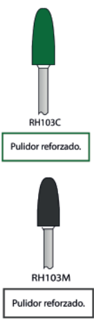
RH103C Polidor reforçado.